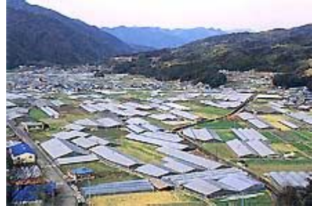
平野部に広がる園芸用ハウス

上流の中山間部では、露地野菜や柚子、自然薯（じねんじょ／やまいも）の栽培も盛んに行われています。