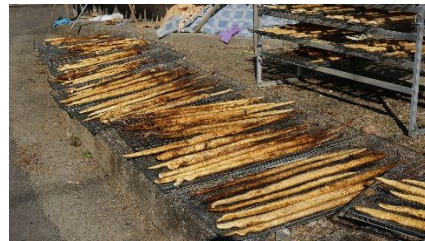
安田町の特産品じねんじょ