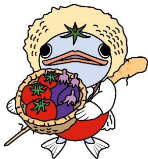
安田町イメージキャラクター